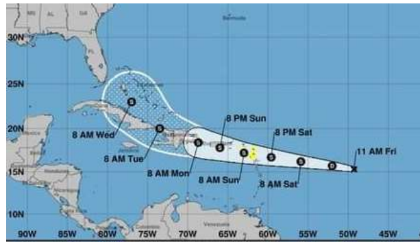
Der Wirbelsturm «GRACE» traf in der Nacht vom 16. auf den 17. August mit voller Wucht auf HAITI